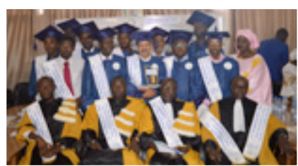
SORTIE DE PROMOTION DU MATIC