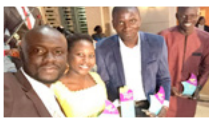
VOIX DES JEUNES AFRIQUE UGB CHAMPION